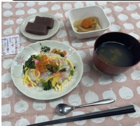
ひな祭り ちらし寿司

バレンタインはオムライス、ひなまつりはちらし寿司を召し上がって頂きました♪ ユニットキッチン焼いたパリパリの餃子を楽しんでいただいた様子も紹介いたします！