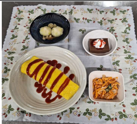
バレンタイン オムライス