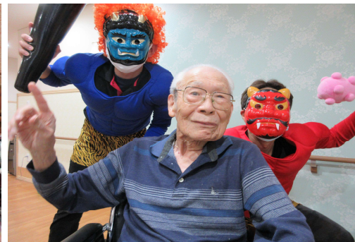
鬼退治・°・。＼(・o・) 最後は仲良く記念撮影♪